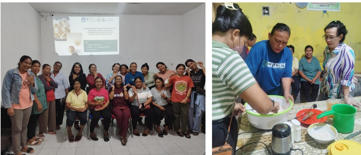
Gambar 2. Pelaksanaan Pelatihan Manajemen Usaha Jemaat di GKII Kambaniru

Selain aspek teknis pengelolaan usaha, peserta juga diberikan pemahaman mengenai pentingnya pemisahan antara keuangan usaha dan keuangan rumah tangga. Selama ini sebagian besar peserta belum melakukan pencatatan sederhana sehingga sulit mengetahui keuntungan usaha yang sebenarnya. Melalui pelatihan ini peserta diperkenalkan pada pencatatan usaha sederhana yang dapat digunakan untuk memantau pemasukan, pengeluaran, dan keuntungan usaha. Kemampuan ini penting untuk mendukung keberlanjutan usaha dan membantu peserta dalam mengambil keputusan usaha yang lebih baik.