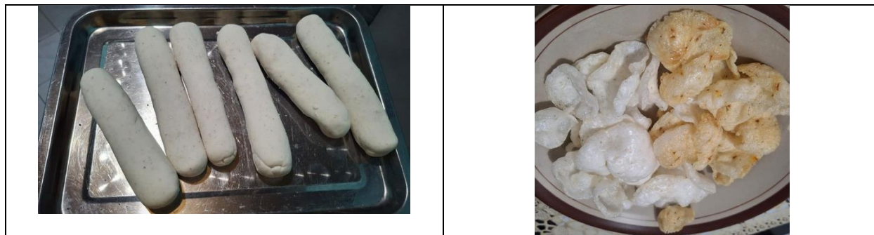
Gambar 3. Inovasi Produk Menjadi Kerupuk Nasi

Selain menghasilkan produk yang lebih bernilai, kegiatan ini juga menumbuhkan motivasi peserta untuk terus mengembangkan inovasi produk sesuai dengan kebutuhan pasar. Dengan adanya variasi rasa, kemasan yang lebih menarik, serta dukungan komunitas gereja, kerupuk nasi memiliki potensi untuk dikembangkan sebagai produk unggulan jemaat yang dapat dipasarkan pada kegiatan gereja, bazar lokal, maupun warung di sekitar wilayah Kambaniru.