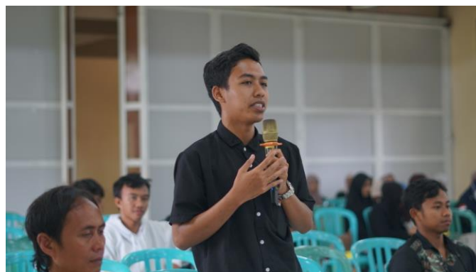
Gambar.3 Sesi tanya jawab peserta pelatihan dan pemateri

Setelah pelatihan dilaksanakan, kegiatan dilanjutkan dengan pendampingan pelatihan penulisan karya tulis ilmiah secara daring (dalam jaringan) melalui Google Meet. Tahap ini dirancang untuk memastikan bahwa pengetahuan yang diperoleh peserta selama pelatihan dapat diimplementasikan secara langsung dalam penyusunan karya tulis ilmiah. Pendampingan dilakukan secara bertahap dengan memberikan ruang konsultasi, diskusi, serta umpan balik terhadap perkembangan tulisan peserta. Model pendampingan semacam ini dinilai penting karena memungkinkan mahasiswa memperoleh bimbingan yang lebih fleksibel dan berkelanjutan tanpa dibatasi oleh ruang dan waktu, sehingga proses belajar tidak berhenti setelah kegiatan pelatihan selesai (Samad et al., 2026). Selain itu, pembinaan yang dilakukan secara berjenjang juga menjadi strategi yang efektif untuk membantu mahasiswa mengembangkan kemampuan riset dan penulisan ilmiah secara lebih sistematis (Mufidah et al., 2024).