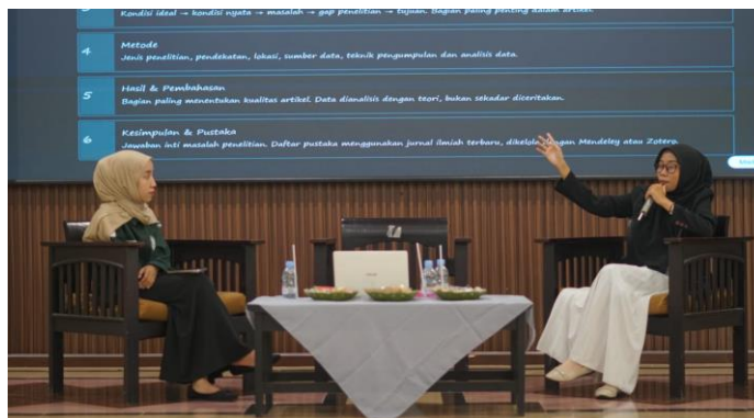
Gambar.2 Penyampaian materi penguatan tradisi keilmuan dan penulisan karya tulis ilmiah

Selain itu, peserta diperkenalkan pada tahapan penyusunan artikel ilmiah mulai dari penentuan topik, penyusunan judul, pengorganisasian isi artikel, hingga pengenalan proses publikasi pada jurnal ilmiah. Selama kegiatan berlangsung, peserta menunjukkan antusiasme yang tinggi yang terlihat dari keterlibatan aktif dalam sesi diskusi, penyampaian pertanyaan, serta berbagi pengalaman terkait berbagai kendala yang mereka hadapi dalam penulisan karya ilmiah.