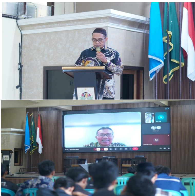
Gambar.1 Sesi pembukaan